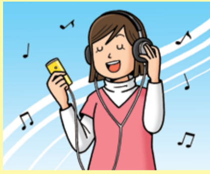
携帯電話にダウンロード

みんなはふだん、いろいろなところで音楽を楽しんでいるよね。音楽をつくった人たちの権利を守るため、「著作権法」という法律があるのを知っているかな？